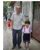
Tâm với Tâm

Và sau đây là hình các cháu chưa có cơ hội được gặp người bảo trợ của các cháu..