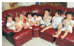
Các cháu bé nhất